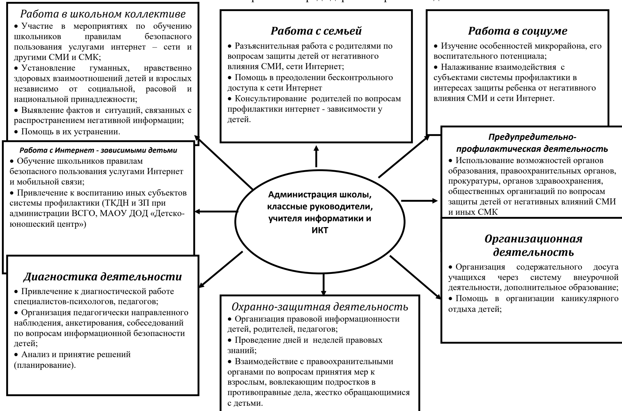
Схема деятельности школы по предупреждению незаконного распространения информации в СМИ и иных СМК, способной причинить вред здоровью и развитию детей